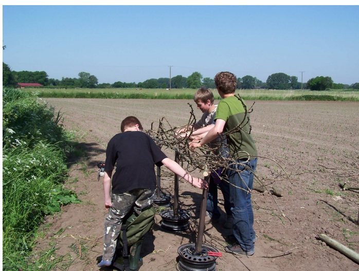
Zusammenlegen von Reisigmaterial auf Böcken