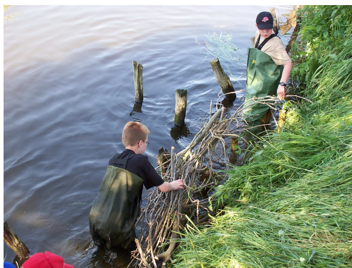
Einbau einer Faschine an einer Abbruchkante